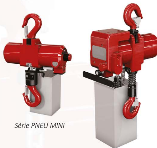
Série PNEU MINI