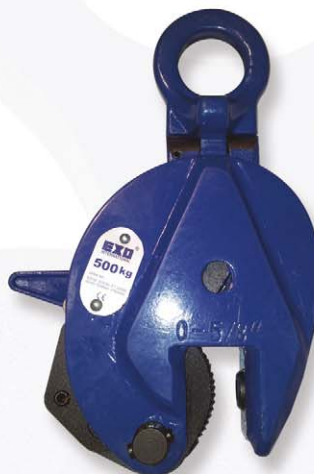
Pince articulée - Type AR