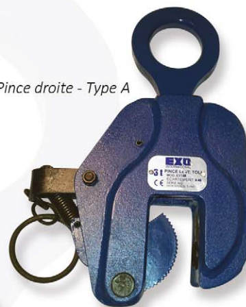
Pince droite - Type A